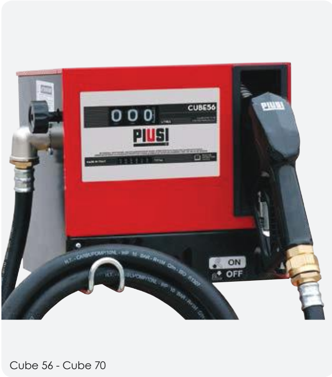
Cube 56 - Cube 70